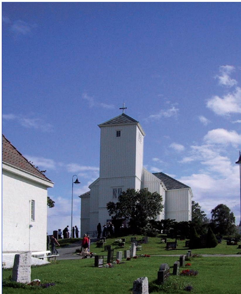
Malvik kirke 2001