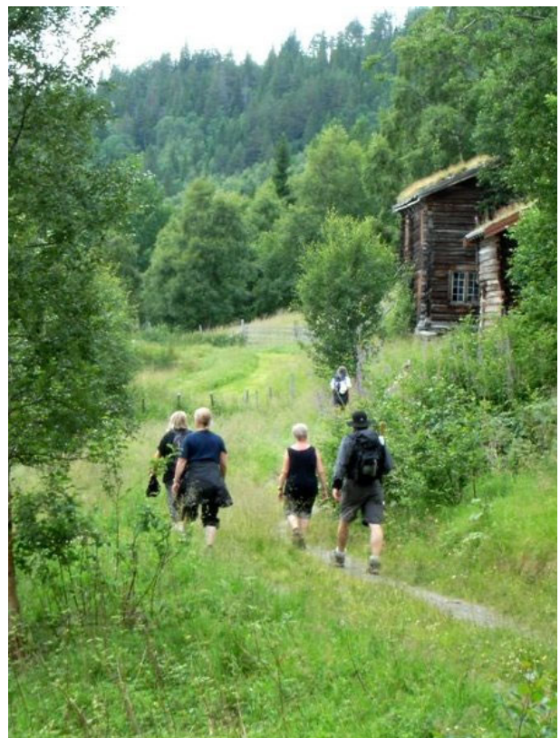
Pilegrimene på veg mot Meslo gård, juli 2005

Vandringene mot Nidaros har det til felles at de ender ved Olsok og Olavsvaka lørdag 28. juli i Nidaros ved Nidarosdomen.